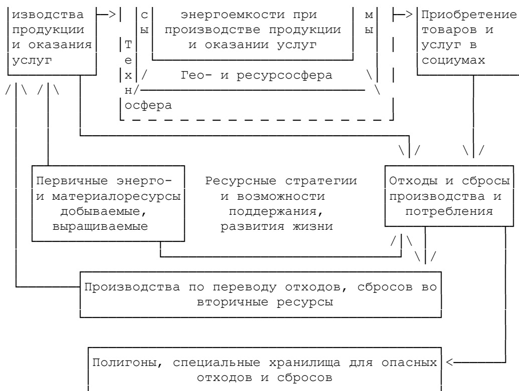
Рисунок А.1. Стратегическая структуризация сфер жизнедеятельности общества во взаимодействии техносферы с биосферой. (Модель "НОМО-STRATEGIC" на основе ИСО 13600 [7])

А.2.7. Социосфера - социальная общность людей, вступающих в различные производственные, культурные и родственные отношения друг с другом и окружающей средой.